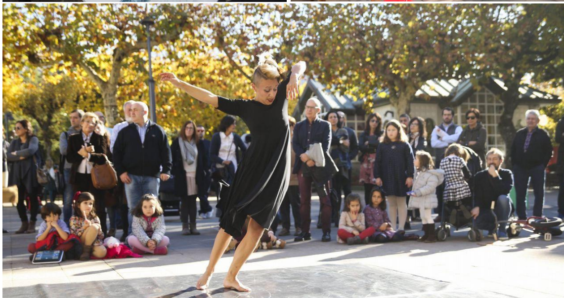
(Imaxes das anteriores edición con Christian Villamide (2018), Basilisa Fiestras (2018) e CF DANCE (2017) )